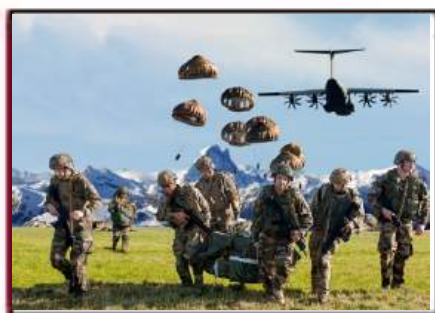
École des troupes aéroportées Pau Pyrénées-Atlantiques

Appel à souscription pour la réalisation de trois bustes