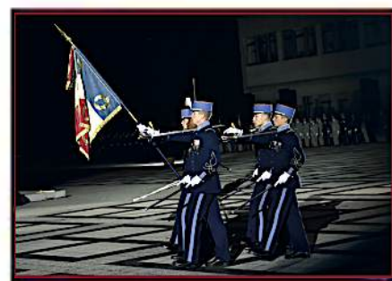
École militaire Interarmes Guer-Coëtquidan Morbihan