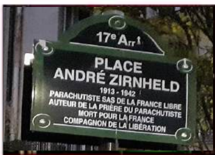
Place André Zirnheld Paris 17 e arrondissement