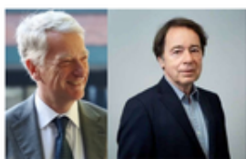
Hervé Gaymard et Jean-Noël Jeanneney