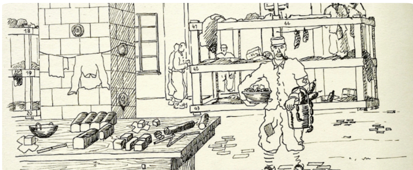
Tristes heures, joyeux moments au Stalag VIII C de Sagan par Henri Beauvois

Histoire & Mémoire de la Captivité 1939-1945 Association affiliée au Souvenir Français