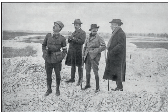
Edmond Rostand en visite sur le front, dans les ruines de Gerbéviller et avec Maurice Barrès.