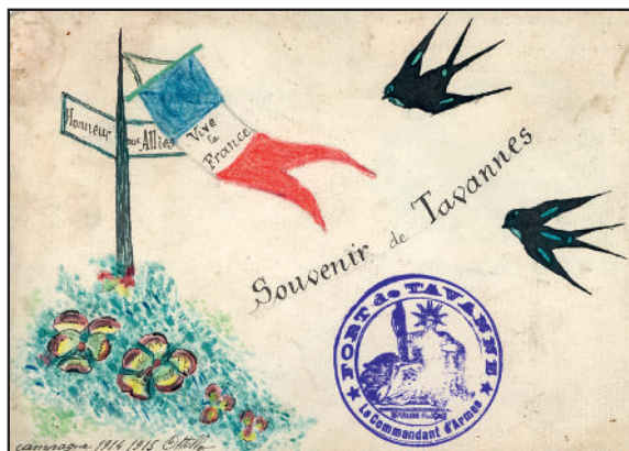
Dessin et carte de Gabriel Ottello