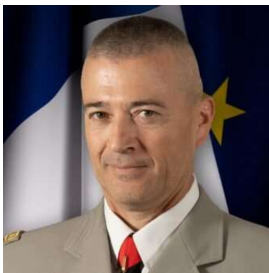
Le général (25) Thierry BURKHARD lors de son adieu aux armes.

Le 19 septembre 2025, le Président de la République a nommé le général d'armée (25) Thierry BURKHARD délégué national de l'Ordre de la Libération, à compter du 1 er octobre 2025.