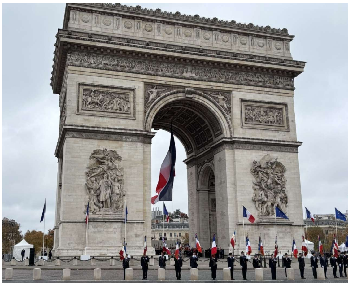
L'Arc de Triomphe lors des cérémonies du 11 novembre 2025.

Après une année passée à la Présidence de notre Association Nationale de Descendants de Médaillés de la Résistance Française, permettez-moi de vous dire, chers amis, qu'à votre contact j'ai beaucoup appris et que je suis très honoré de vous représenter. C'est dire que les Valeurs qu'ont défendu nos « pères » au péril de leur vie sont toujours d'actualité et que notre combat mémoriel n'est pas vain. La flamme de la Résistance qui brûle au pied de l'Arc de Triomphe ne s'est pas éteinte, aux heures sombres de notre histoire et ne s'éteindra pas, grâce à nous tous.