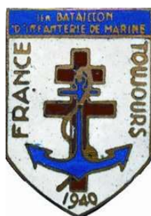
Écusson du BIM.

Après une année passée à la Présidence de notre Association Nationale de Descendants de Médaillés de la Résistance Française, permettez-moi de vous dire, chers amis, qu'à votre contact j'ai beaucoup appris et que je suis très honoré de vous représenter. C'est dire que les Valeurs qu'ont défendu nos « pères » au péril de leur vie sont toujours d'actualité et que notre combat mémoriel n'est pas vain. La flamme de la Résistance qui brûle au pied de l'Arc de Triomphe ne s'est pas éteinte, aux heures sombres de notre histoire et ne s'éteindra pas, grâce à nous tous.