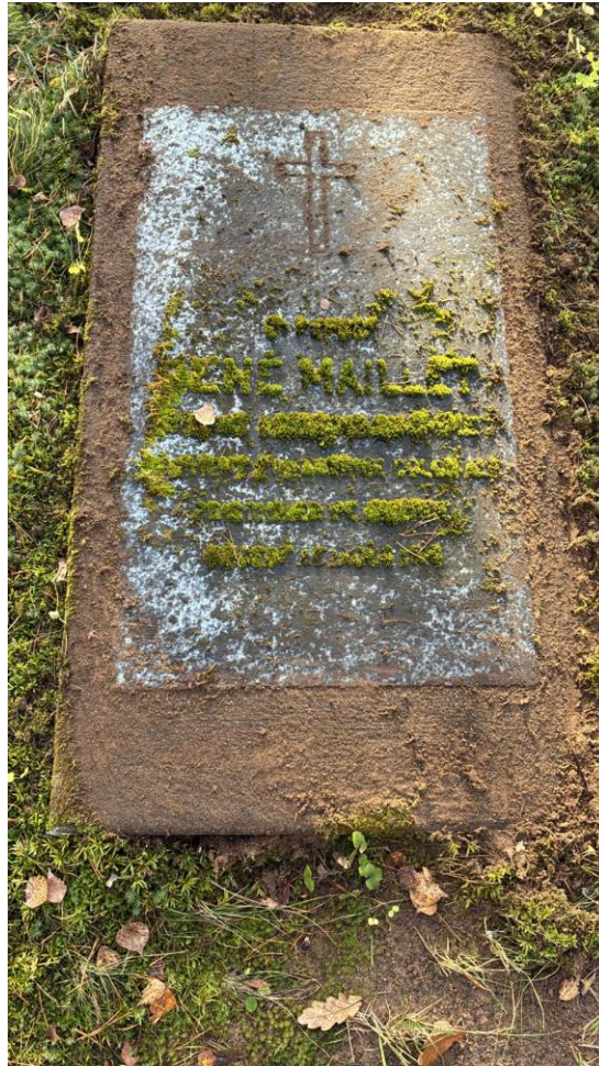
Photo de la tombe du Marsouin René Maillet prise début novembre 2025

Un appel pour remettre en état la tombe durant l'été 2025 est resté sans réponse. Une nouvelle tentative sera faite au printemps 2026. Au minimum, nous sommes preneurs de conseils pour que la remise en état se fasse sans dégrader la tombe, notamment sans abimer les inscriptions et, au contraire, en les mettant en valeur.