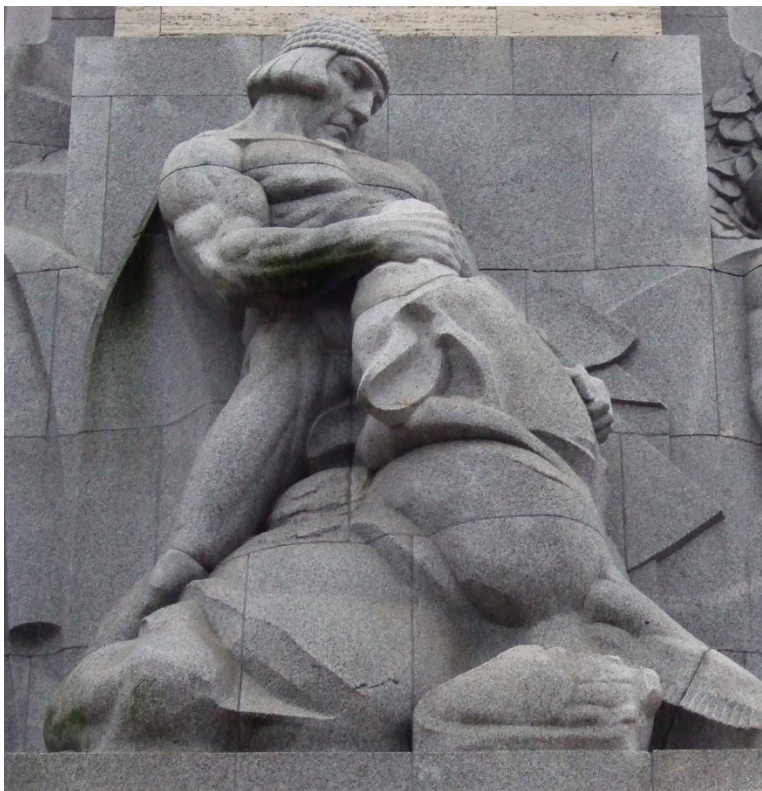
Lāčplēsis sur le socle du monument de la Liberté à Riga