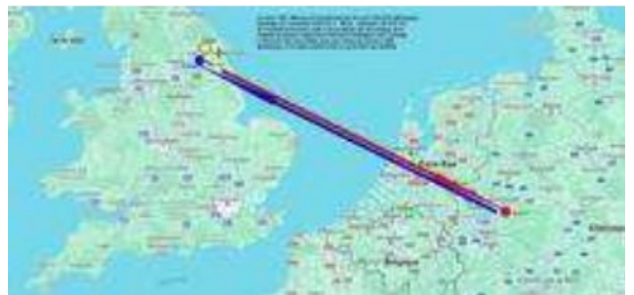
Y1 Elvington Hull Hagen 15 03 45