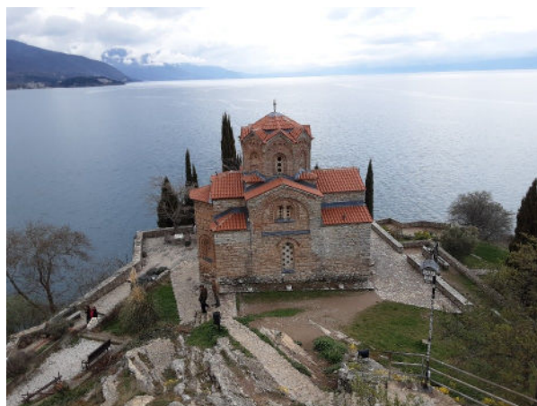
Découverte de Ohrid, lac et culture religieuse orthodoxe