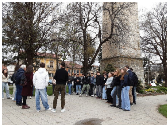
Présentation en français par les élèves macédoniens du centre historique de Bitola