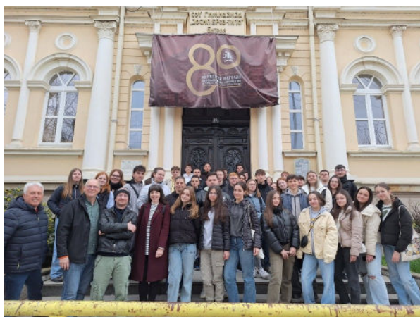
Groupe devant le lycée Josip Broz Tito