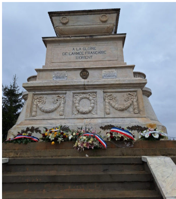
Dépôts de gerbes sur l'ossuaire par les élèves : honorer la mémoire des soldats