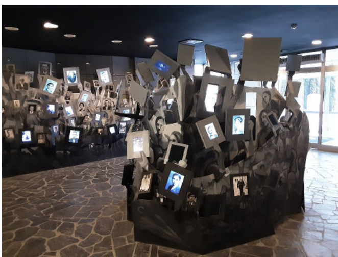
Visite du mémorial de la Shoah à Skopjé en avril 2025