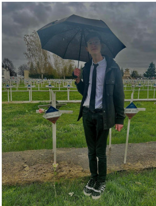
Fleurissement de la sépulture d'un soldat de Coutances