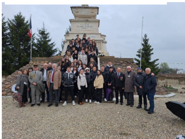
Les participants à la cérémonie organisée par les élèves