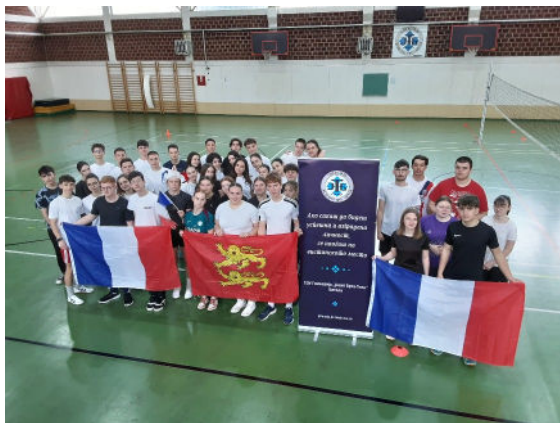
Autres moments festifs : olympiades sportives/Normandie-Macédoine