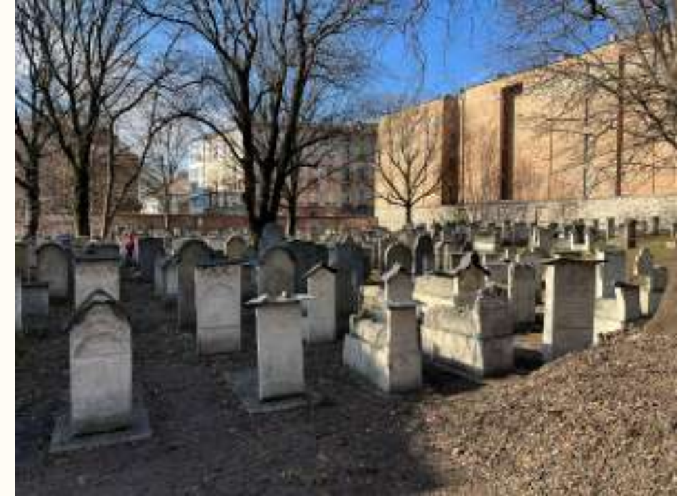
tombes en pierre