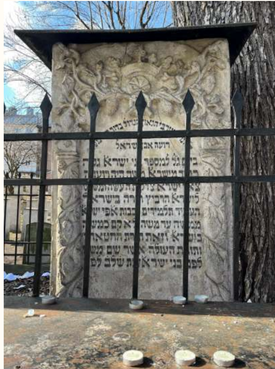
tombe d'un rabbin

Une partie du mur intérieur est constituée de stèles détruites par les nazis.