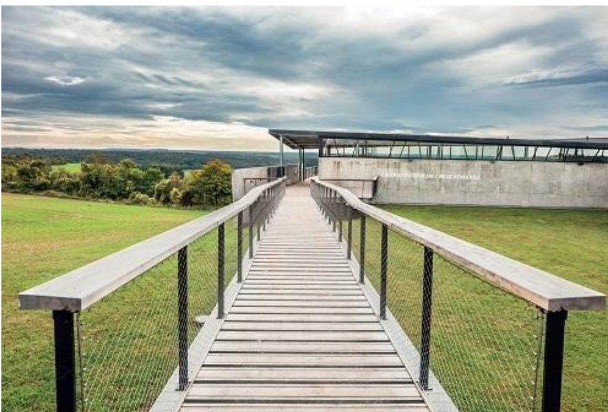
La Caverne du Dragon, Musée depuis 1969

Mais les combats des 25 et 26 janvier 1915 ont été particulièrement meurtriers : plus de 2 000 tués (au moins 850 Allemands, peut-être 1 500 Français) en deux jours. 1 100 Français ont été faits prisonniers.