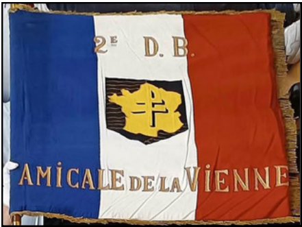
Drapeau déposé le 03 mai 2024 au lycée Le Dolmen de Poitiers (86).