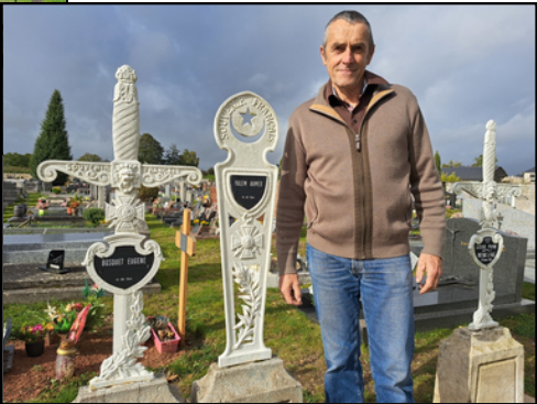
“Tombes siamoises” dans le cimetière d'Argentan