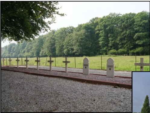
Nécropole nationale des Gateys ONAC Calvados