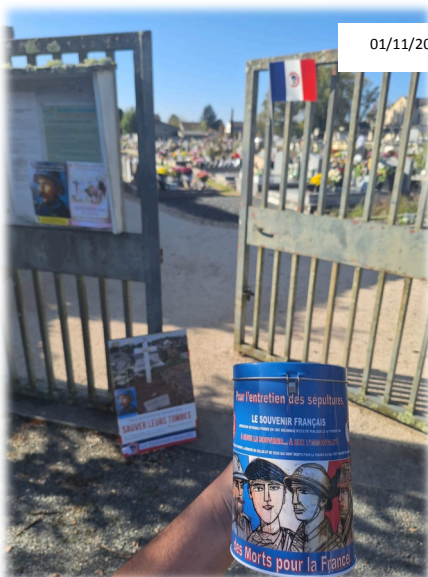
01/11/2024 – QUÊTE NATIONALE / CIMETIÈRE S TE -FOY-LA-GRANDE (33)