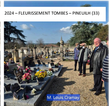
2024 – FLEURISSEMENT TOMBES – PINEUILH (33)