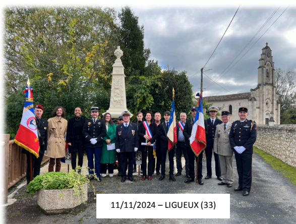
11/11/2024 – LIGUEUX (33)