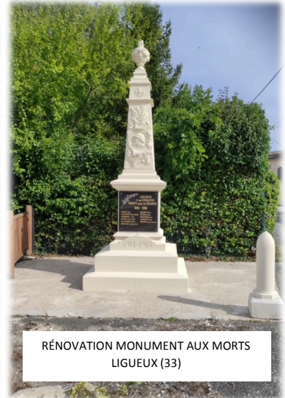
RÉNOVATION MONUMENT AUX MORTS LIGUEUX (33)