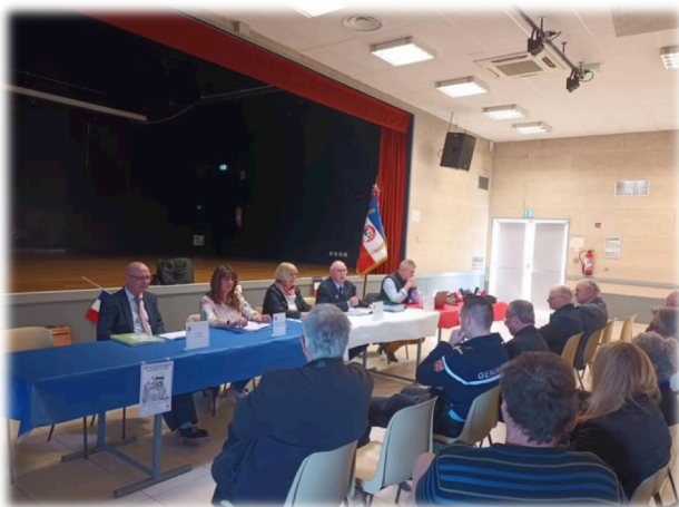
Salle des fêtes de Pineuilh (33 – Gironde) Le bureau du comité du Pays Foyen du Souvenir Français face aux participants