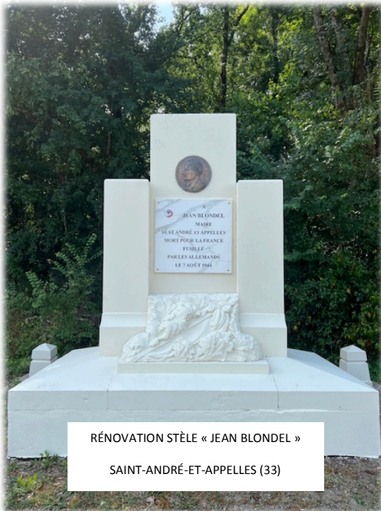
RÉNOVATION STÈLE « JEAN BLONDEL » SAINT-ANDRÉ-ET-APPELLES (33)