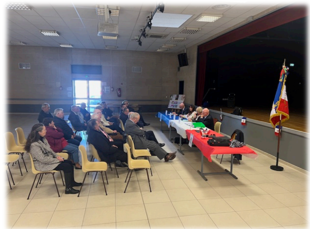
Le bureau du comité du Pays Foyen du Souvenir Français Un présentoir placé à gauche, le drapeau tricolore placé à droite du bureau