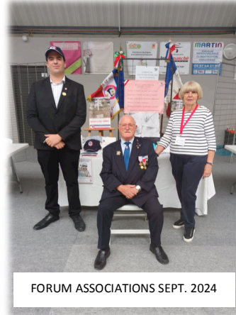
FORUM ASSOCIATIONS SEPT. 2024