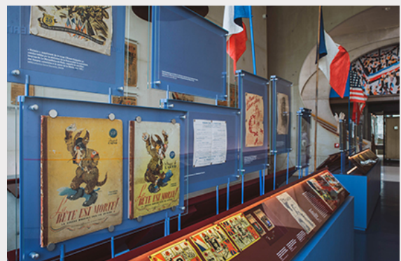
Le nouveau musée.