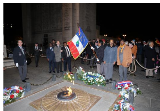
Cérémonie du ravivage de la flamme