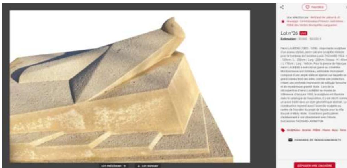
Capture d'écran du site interenchères